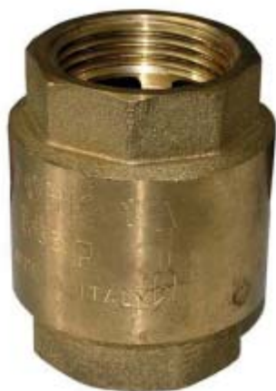
Clapet à opercule YORK

Pour installation hydraulique, chauffage, air conditionné