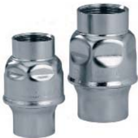
Clapet de retenue INOX

Pour installation hydraulique, chauffage, air conditionné