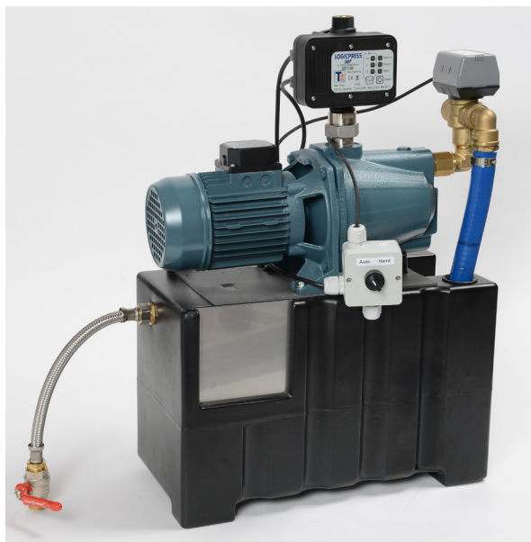
Ensemble complet livré prêt à être raccordé