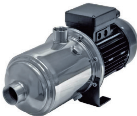
EHsp 3/4 ou 3/5