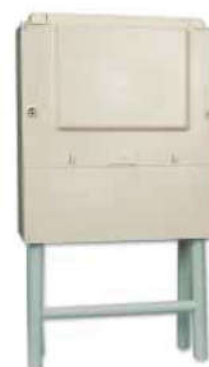
Embase pour ancrage béton et fixation armoire