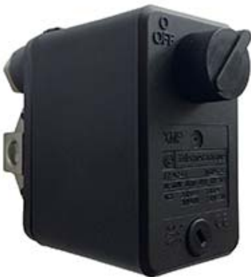
XMP 6 - XMP 12

Il met en service votre pompe lorsque la pression baisse (pression d'enclenchement) et arrête la pompe lorsque la pression remonte au dessus d'une certaine valeur (pression de déclenchement)