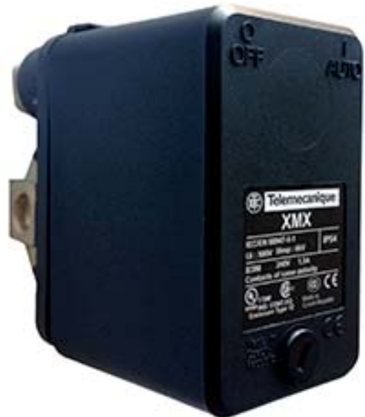
XMx6 Pressostat inversé pour manque d'eau